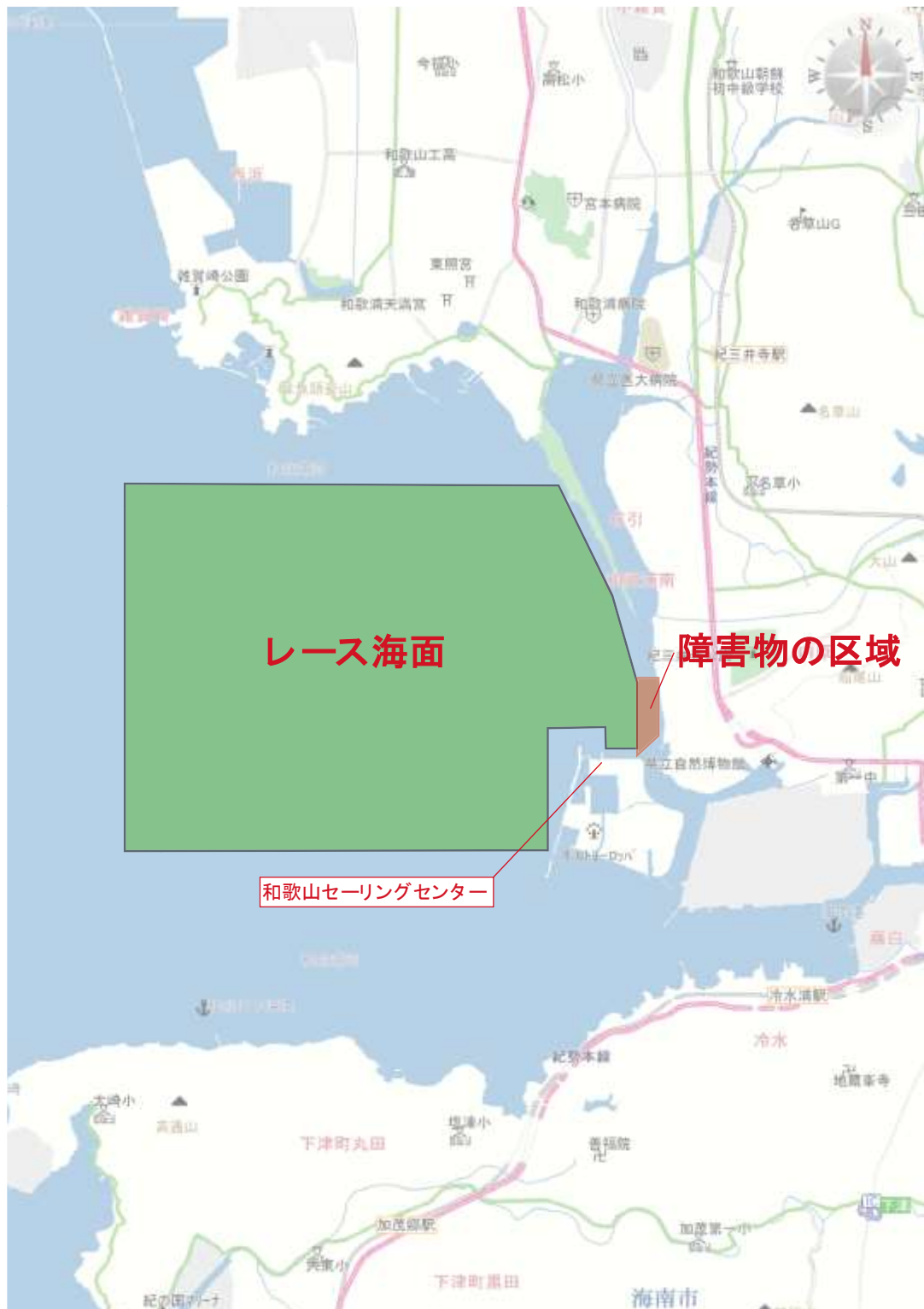
添付図1 ハーバー及びレース・エリアの場所