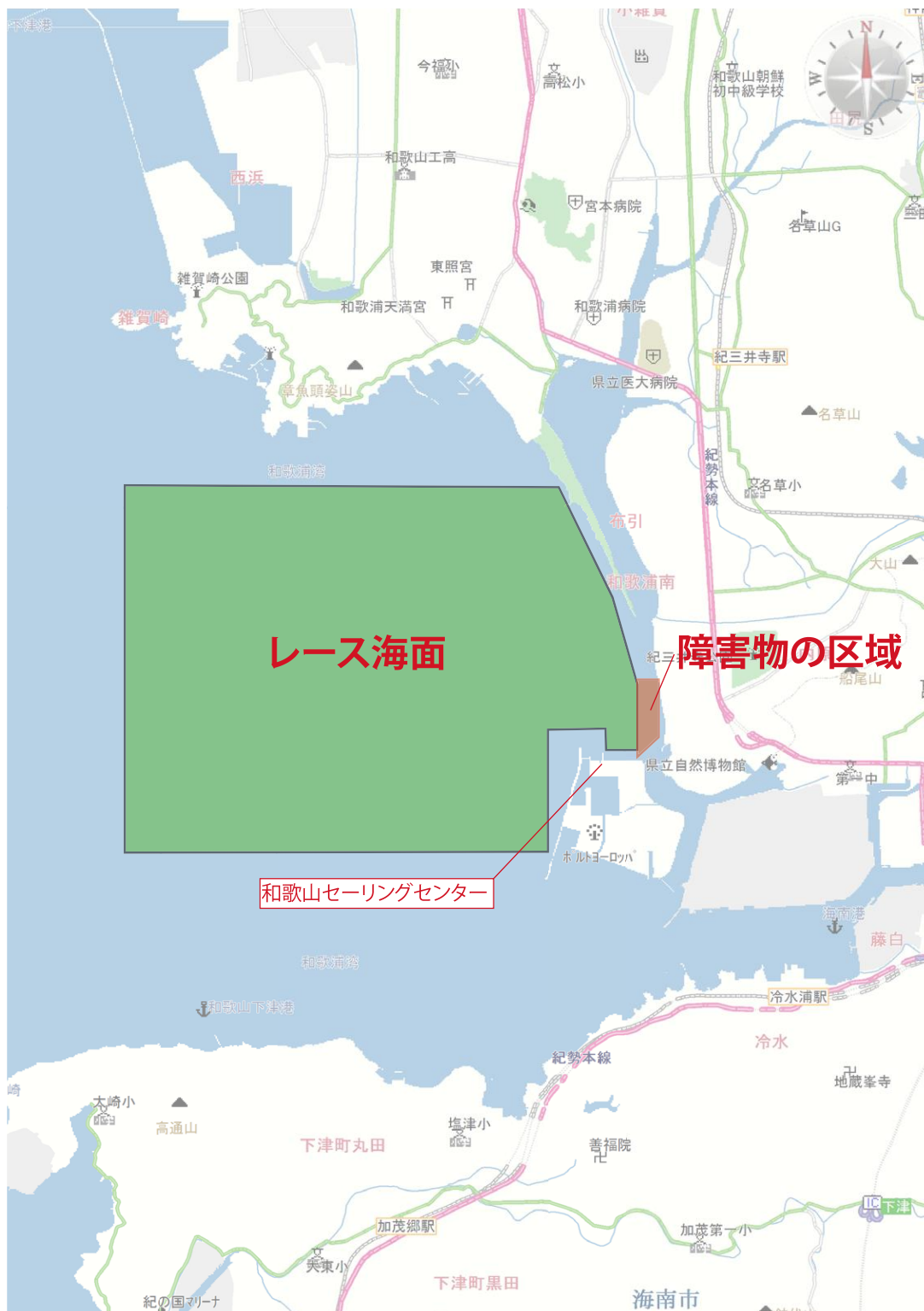
添付図1 ハーバー及びレース・エリアの場所